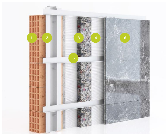
Mögliche Installation an belüfteter Fassade.

In allen Szenarien ist es zwingend erforderlich, die NF DTU 24-1 Vorschriften für die Behandlung von Rauchkanälen einzuhalten. Und DTU 70-1 und 70-2 für die Behandlung von elektronischen Elementen.